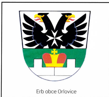
Erb obce Orlovice

Do našich soutěží se zapojují dominantní i alternativní dodavatelé. Ještě před tím, než dodavatele zařadíme do energetické soutěže, ověřujeme jeho spolehlivost a kvalitu. Také díky tomu garantujeme vysokou úroveň energetické soutěže, díky které můžete ušetřit významné prostředky za dodávky elektřiny a plynu.